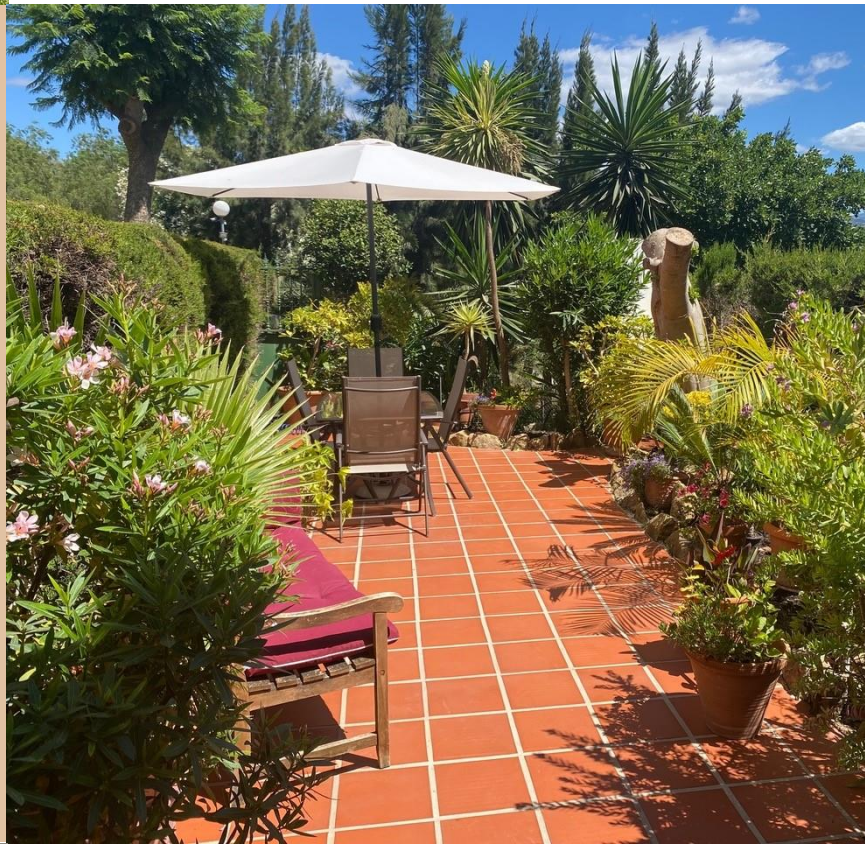
Terrasse mit Esstisch und Sonnenschirm