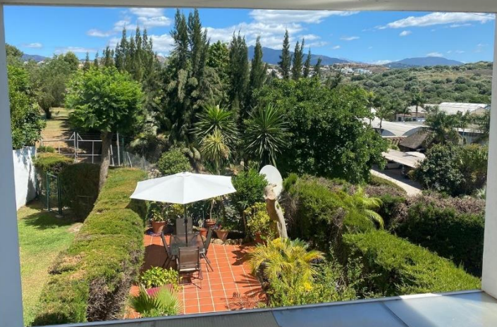
Blick auf die Berge vom Elternschlafzimmer

In Marbella und Umgebung gibt es diverse Golf Clubs, der Nächste (El Paraiso) ist 4km entfernt. Zum Tennisclub sind es 200m.