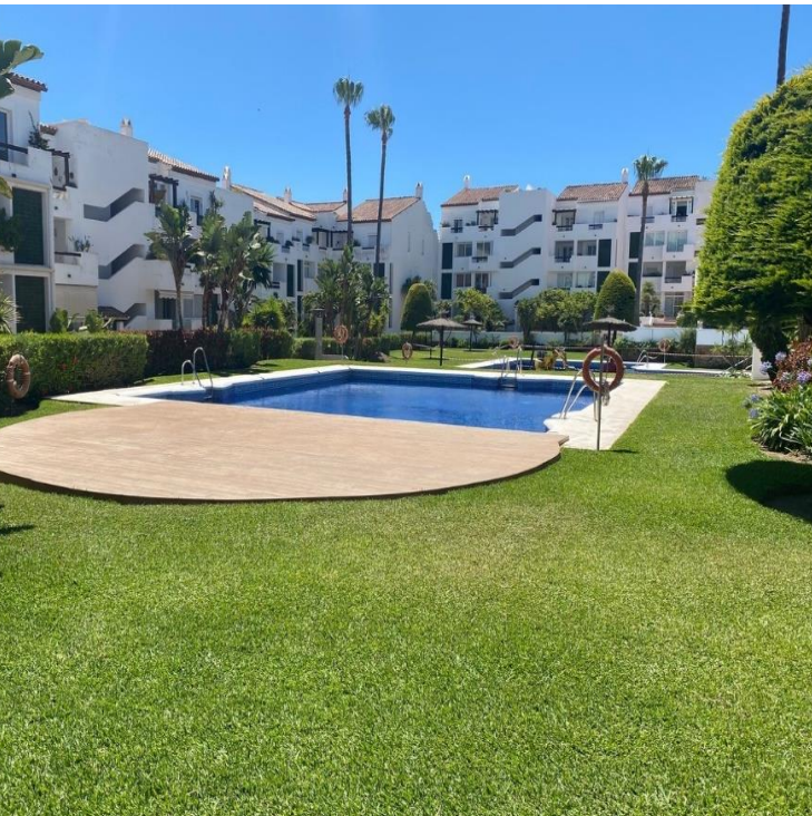
Pool 1 in der Urbanizacion