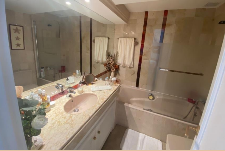
Bad 2 mit Badewanne, WC, Bidet und Waschbecken