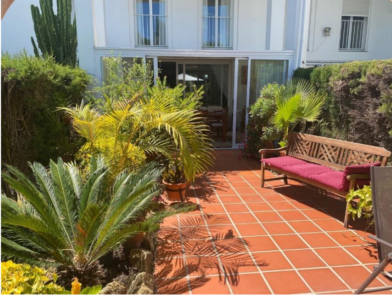
Terrasse mit zusätzlicher Sitzgelegenheit