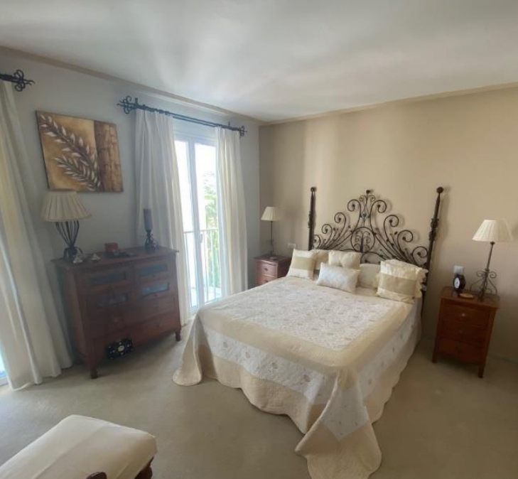
Elternschlafzimmer (Doppelbett 150x190cm)